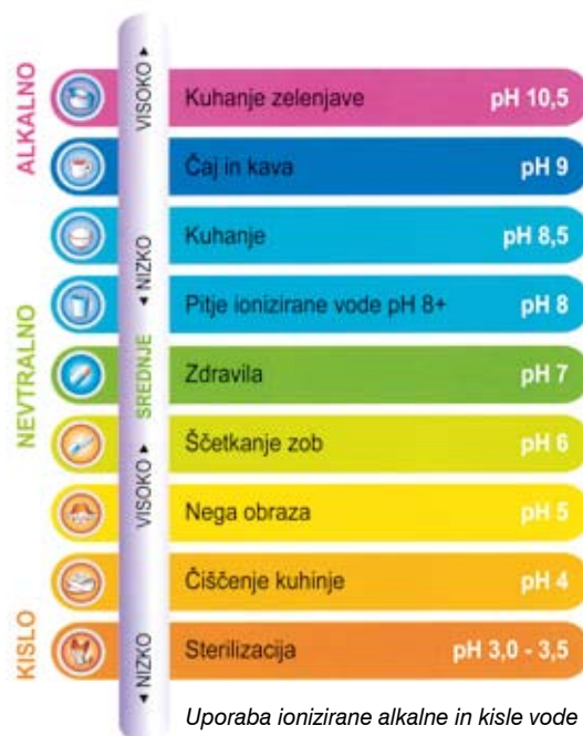
Uporaba ionizirane alkalne in kisle vode

Kronična zakisanost organizma zmanjšuje vašo naravno odpornost. Mnoge študije zakisanost organizma povezujejo z mnogimi bolezenskimi stanji. Ionizirana bazična voda je "živa voda". Ima bazičen pH in veliko število hidroksilnih ionov, zato pomaga odstraniti zakisane odpadke iz telesa.